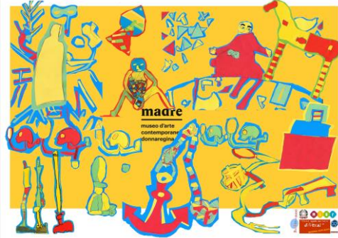
manifesto museo MADRE Napoli