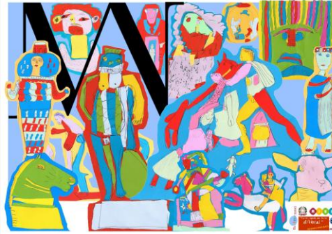
manifesto museo MANN Napoli